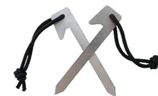
штырь 250 мм по 3 штуки на пирамиду