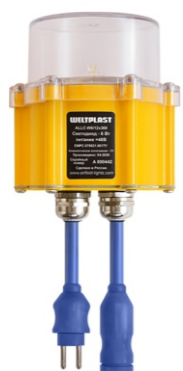
доковой озонь ВПП (центральная часть)