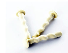
дюбель-звездь по 3 штуки