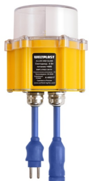
озонь знака приземления