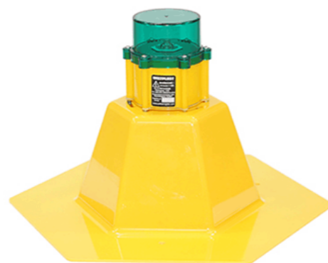
пирамида озня ССО 250 мм