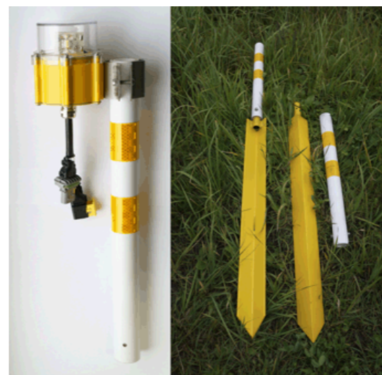
Стойка озня ССО «Игла»