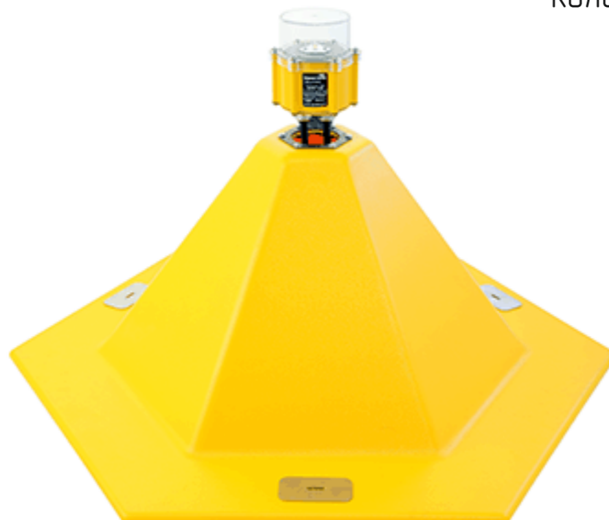
пирамида озня ССО 450 мм