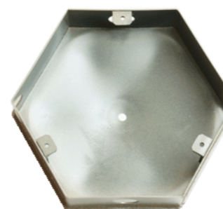
колодец для пирамиды 250 мм в бетон