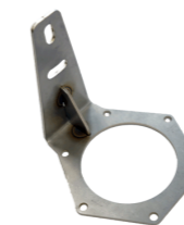
кронштейн на пирамиду 450 мм