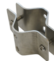
Кронштейн на стойку