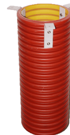
колодец для пирамиды 250 мм в грунт