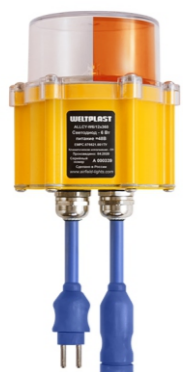
доковой озонь ВПП (последние 300м)